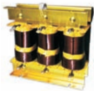
Bobinado de cobre